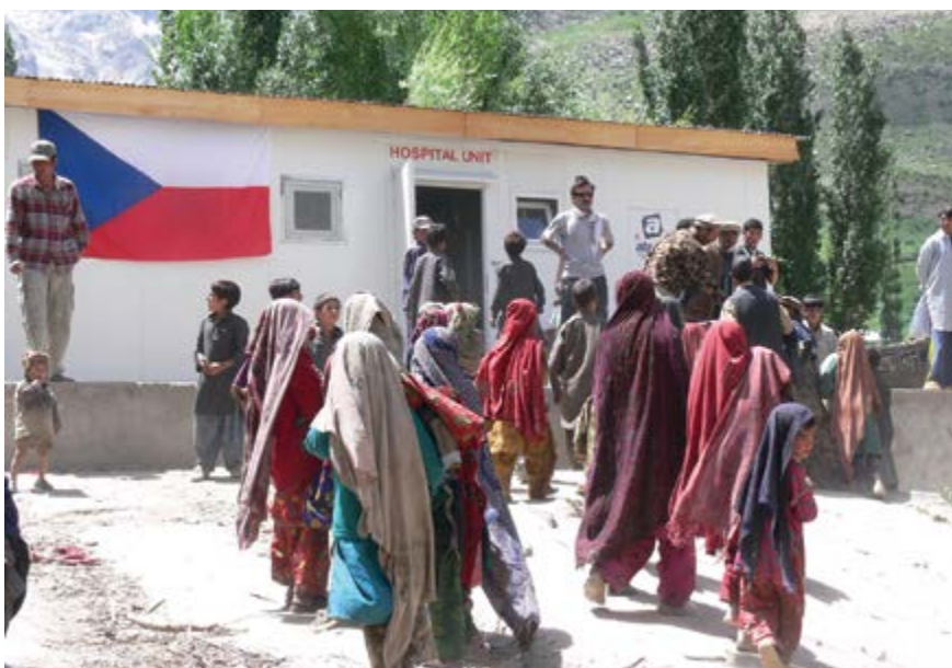
Pacienti svoji nemocnici navštěvují s důvěrou