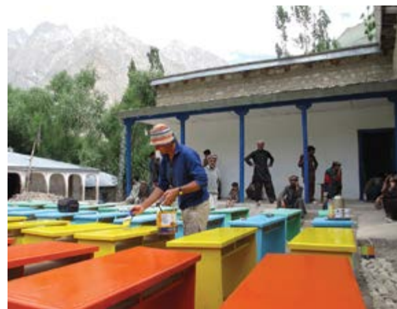
Natíráme školní lavice

přítomnosti vtipně komentoval větou, „že se nemůžeme divit, když teď tamější základní škola praská ve švech“.