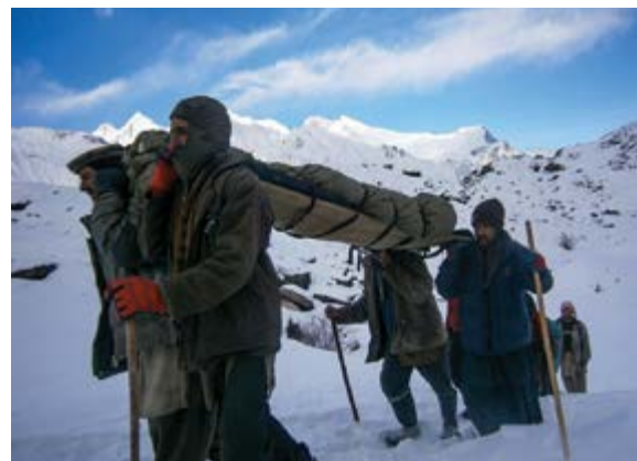
Záchranné „komando“ Arandanů

text Dina Štěrbová