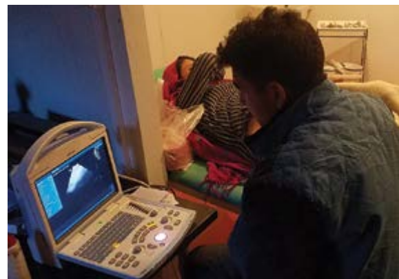
Nový ultrazvukový přístroj, přivezený vloni

Až euforickou radost nám udělala zpráva na jaře dalšího roku, 2008, o tom, že v průběhu právě uplynulé zimy, prvně, co lidé pamatovali, neumřelo v Arandu na zápal plic žádné dítě, ač v předchozích letech to vždy kolísalo mezi 10 až 15 případy. Tuto změnu také způsobila námi zanechaná zásoba antibiotik. To se pak pravidelně opakovalo každou zimu až do dnešních dní, s výjimkou dvou případů, což jeden úředník vloni ve Skardu v mé