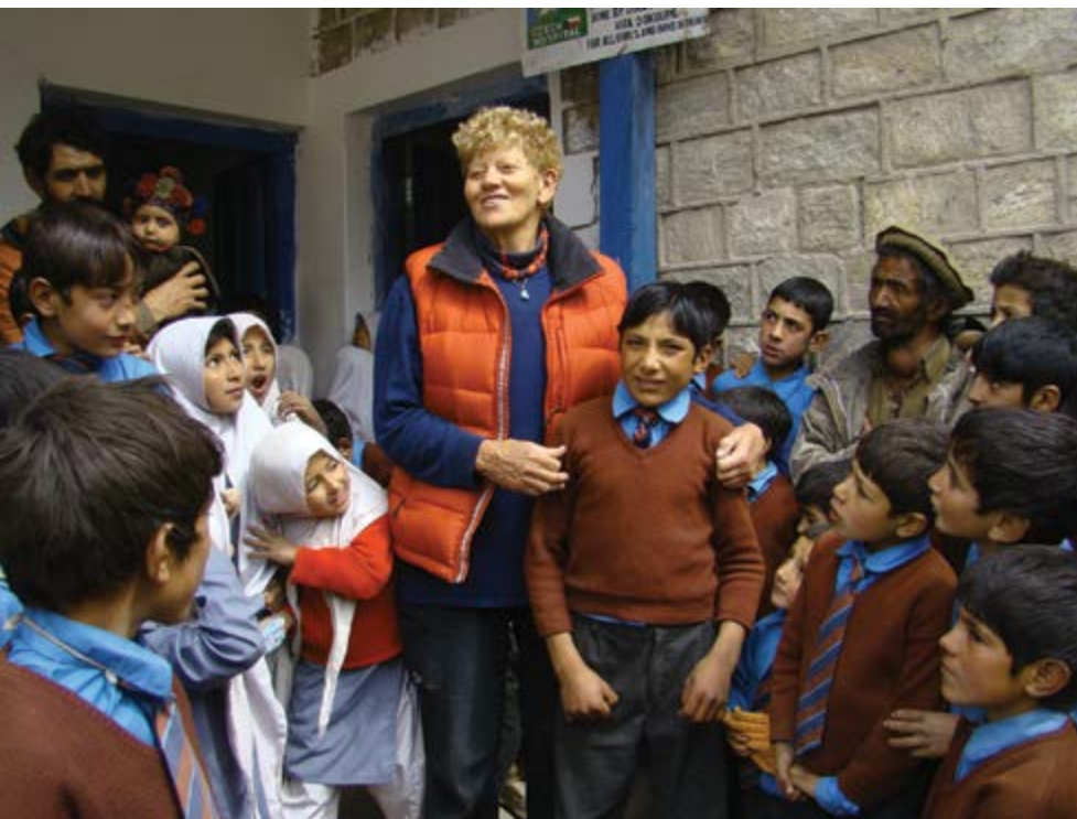
Místní škola po rozšíření a rekonstrukci