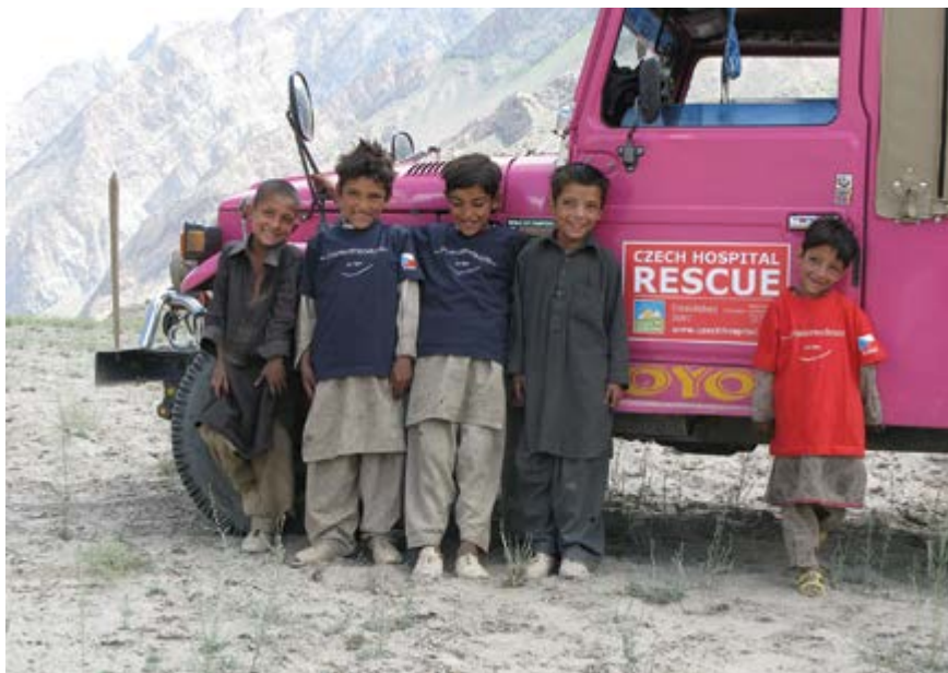
Dva námi darované džípy položily základ záchranné služby