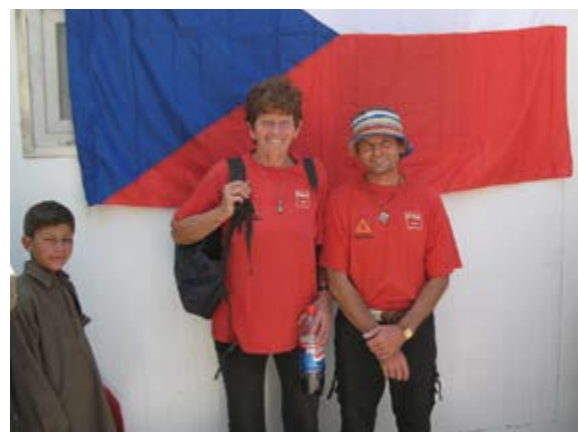
Jsmo hrdí na svoji vlajku

Řetěz na kolo? Jedno špatné parkování? Kilo Chicken McNuggets™? Jedno nefunkční tričko? Jedno oholení ve stylovém barber shopu?