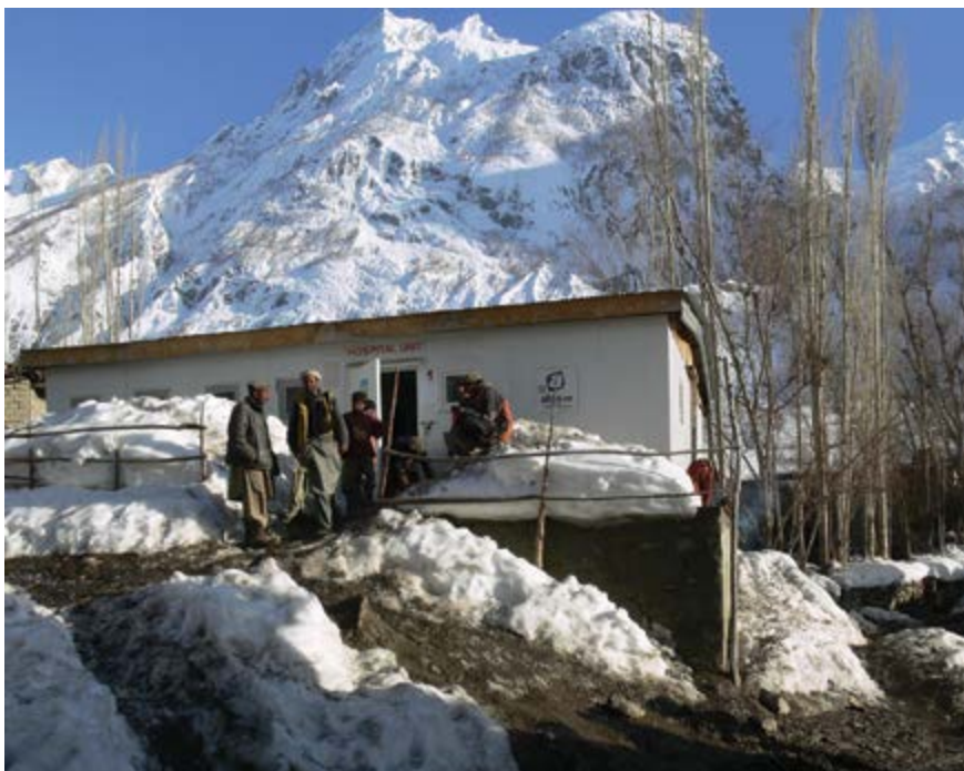
C. H. funguje i v zimě

Výběr místa pro nemocnici i samotný transport čtyřia dvaceti terénními džípy až pod ledovec Čhogo-Lungma do vesnice Arandu jsme bez nadsázky s nasazením