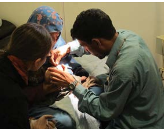
Najaf zachraňuje na smrt dehydratované dítě